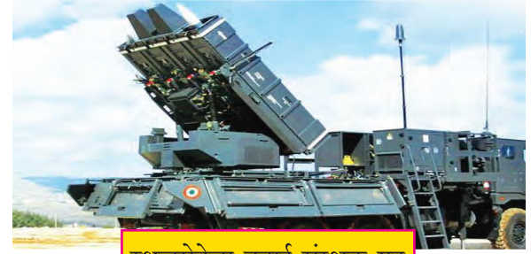
स्थलसेनेचा हवाई संरक्षक गट