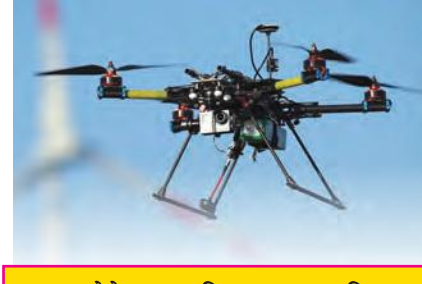
स्थलसेनेचा शत्रूविषयक ज्ञान विभाग