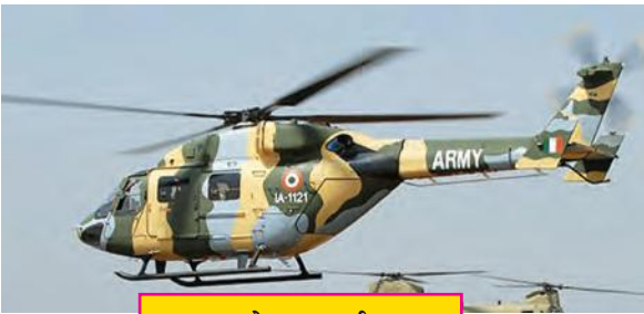
स्थलसेना हवाई गट