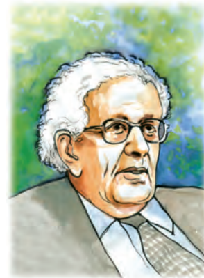
डॉ. होमी सेठना

पोखरण येथील पहिली अणुचाचणी : शांतता व स्वयंपूर्णतेसाठी अणुऊर्जेचा उपयोग या धोरणास अनुसरून भारताने १८ मे १९७४ रोजी राजस्थानमधील पोखरण येथे पहिली अणुचाचणी