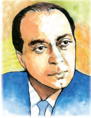
डॉ. होमी भाभा

भारतीय अणुऊर्जा आयोग : भारताचे प्रधानमंत्री पंडित जवाहरलाल नेहरू यांना वैज्ञानिक दृष्टिकोन