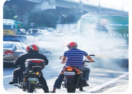
8.3 : مختلف اجزا کی وجہ سے فضائی آلودگی