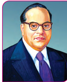
डॉ. बाबासाहेब आंबेडकर

द्वितीय र गो मेज परषद : १९३१ ई. में द्वितीय गोलमेज परिषद का आयोजन किया गया। इस परिषद में राष्ट्रीय कांग्रेस के प्रतिनिधि के रूप में महात्मा गांधी उपस्थित थे। राष्ट्रीय कांग्रेस के साथ-साथ भारत को विभिन्न जातियों-जनजातियों, दलों तथा रियासतदारों के प्रतिनिधियों को भी बुलाया गया था। गोलमेज परिषद में सरकार ने अल्पसंख्यकों का मुद्दा उपस्थित किया। इस मुद्दे को लेकर और भावी संघराज्य के संविधान के स्वरूप को लेकर मतभेद निर्माण हुए। गांधीजी ने सभी में एकमत निर्माण करने का प्रयास किया परंतु वे विफल रहे। अंततः निराश होकर गांधीजी भारत लौट आए।