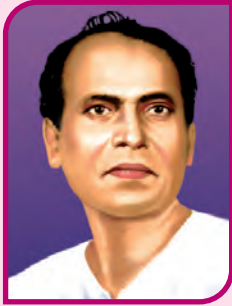
लोकशाहीर अण्णाभाऊ साठे