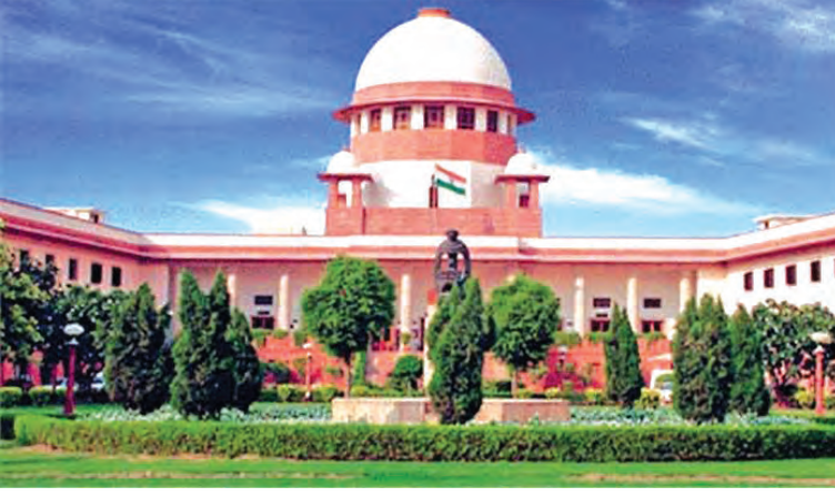
भारत का उच्चतम न्यायालय-नई दिल्ली