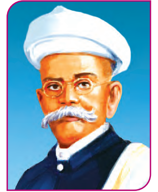
डॉ. रा.गो. भांडारकर

भाषांमधील हस्तलिखिते तपासून त्यावरील संशोधने प्रसिद्ध केली. डॉ. भाऊ दाजी लाड, डॉ. रा.गो. भांडारकर अशा काही भारतीय विद्वानांनी प्राचीन भारतीय संस्कृतीचा सखोल अभ्यास केला. आपल्याला प्राचीन समृद्ध वारसा लाभला आहे हे समजल्याने भारतीयांची अस्मिता जागृत झाली. पुणे येथे 'भांडारकर प्राच्यविद्या संशोधन मंदिर' ही संस्था गेल्या शंभर वर्षांपासून कार्यरत आहे.