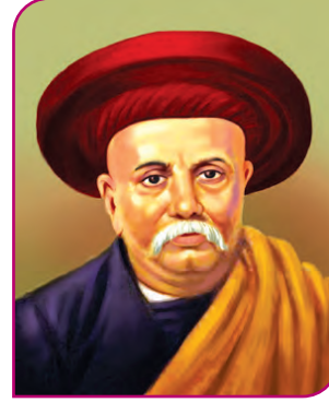
डॉ.भाऊ दाजी लाड

कोलकाता येथे ब्रिटिशांनी 'एशियाटिक सोसायटी'ची स्थापना केली. अनेक भारतीय व पाश्चिमात्य विद्वानांनी भारतीय संस्कृतीचा अभ्यास सुरू केला. संस्कृत, फारसी आणि अन्य भारतीय