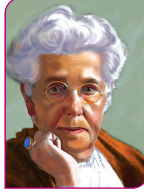
डॉ. अंनी बेझंट

मंडालेच्या तुरुंगातून सुटका झाली तेव्हा युरोपात पहिल्या महायुद्धाला तोंड फुटले होते. या युद्धाचे थेट परिणाम भारतालाही भोगावे लागले. दैनंदिन गरजेच्या वस्तूंचे भाव वाढले. ब्रिटिश सरकारने भारतीयांवर अनेक निर्बंध लादले. यामुळे भारतीयांत असंतोष वाढू लागला. अशा परिस्थितीत डॉ.अंनी बेझंट व लोकमान्य टिळक यांनी होमरूल चळवळ सुरू केली. होमरूल म्हणजे आपला राज्यकारभार आपण करणे यालाच स्वशासन म्हणतात. आयर्लंड या देशातही वसाहतवादाविरुद्ध अशी चळवळ सुरू झाली होती. त्याच धर्तीवर भारतीय होमरूल चळवळीने स्वशासनाचे अधिकार ब्रिटिश सरकारकडे मागितले. डॉ.अंनी बेझंट व लोकमान्य टिळक यांनी देशभर झंझावाती दौरे काढून स्वशासनाची मागणी लोकांपर्यंत पोचविली. 'स्वराज्य हा माझा जन्मसिद्ध हक्क आहे व तो मी मिळवणारच!' असे टिळकांनी ठामपणे सांगितले.