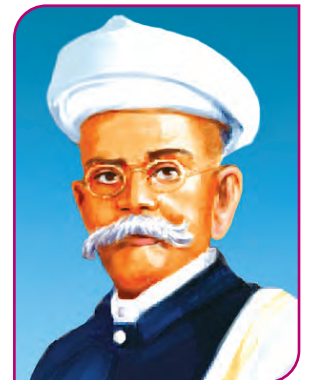
डॉ. रा. गो. भांडारकर

कोलकाता में अंग्रेजों ने 'एशियाटिक सोसाइटी' की स्थापना की। कई भारतीय और पश्चिमी विद्वानों ने भारतीय संस्कृति का अध्ययन प्रारंभ किया। संस्कृत, फारसी और अन्य भारतीय भाषाओं में उपलब्ध पांडुलिपियों की जाँच-पड़ताल कर उनपर शोधकार्य प्रकाशित किए। डॉ. भाऊ दाजी लाड, डॉ. रा. गो. भांडारकर जैसे कुछ भारतीय विद्वानों ने प्राचीन भारतीय संस्कृति का गहन अध्ययन किया। हमें प्राचीन और संपन्न विरासत प्राप्त है, इसका बोध होने से भारतीयों में अस्मिता जागृत हुई। पुणे में 'भांडारकर प्राच्यविद्या संशोधन मंदिर' संस्था विगत सौ वर्षों से कार्यरत है।