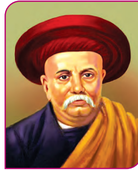
डॉ. भाऊ दाजी लाड

कोलकाता में अंग्रेजों ने 'एशियाटिक सोसाइटी' की स्थापना की। कई भारतीय और पश्चिमी विद्वानों ने भारतीय संस्कृति का अध्ययन प्रारंभ किया। संस्कृत, फारसी और अन्य भारतीय भाषाओं में उपलब्ध पांडुलिपियों की जाँच-पड़ताल कर उनपर शोधकार्य प्रकाशित किए। डॉ. भाऊ दाजी लाड, डॉ. रा. गो. भांडारकर जैसे कुछ भारतीय विद्वानों ने प्राचीन भारतीय संस्कृति का गहन अध्ययन किया। हमें प्राचीन और संपन्न विरासत प्राप्त है, इसका बोध होने से भारतीयों में अस्मिता जागृत हुई। पुणे में 'भांडारकर प्राच्यविद्या संशोधन मंदिर' संस्था विगत सौ वर्षों से कार्यरत है।