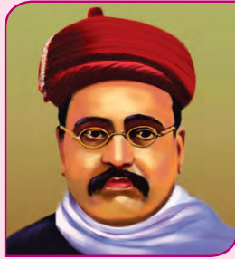
गोपाल कृष्ण गोखले

नामदार गोपाल कृष्ण गोखले ने १९०५ ई. में ‘भारत सेवक समाज’ की स्थापना की। लोगों में देशभक्ति की भावना निर्माण कर स्वार्थत्याग की सीख देना, धर्मों एवं जातियों के बीच के विरोध को नष्ट करना और सामाजिक सौहार्द निर्माण करना, शिक्षा का प्रचार-प्रसार करना आदि भारत सेवक समाज के मुख्य उद्देश्य थे।