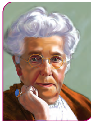
डॉ. एनी बेजेंट

आंदोलन : १९१४ ई. में तिलक मंडाले के कारावास से रिहा हुए। इस समय यूरोप में प्रथम विश्व युद्ध प्रारंभ हुआ था। इस युद्ध के सीधे परिणाम भारत को भी सहने पड़े। आवश्यकता की वस्तुओं के दाम बढ़ गए। अंग्रेज सरकार ने भारतीयों पर अनेक प्रतिबंध लगाए। परिणामतः भारतीयों में असंतोष बढ़ने लगा। इस स्थिति में डॉ. एनी बेजेंट और लोकमान्य तिलक ने होमरूल आंदोलन प्रारंभ किया। होमरूल अर्थात् हम अपना शासन स्वयं चलाते हैं। इसी को स्वशासन भी कहते हैं। आयरलैंड में भी उपनिवेशवाद के विरोध में ऐसा आंदोलन प्रारंभ हुआ था। इसी आधार पर भारतीय होमरूल आंदोलन ने स्वशासन के अधिकार अंग्रेज सरकार के पास माँगे। डॉ. एनी बेजेंट और लोकमान्य तिलक ने पूरे देश में तूफानी दौरे किए और लोगों तक स्वशासन की माँग पहुँचाई। तिलक ने दृढ़तापूर्वक कहा, 'स्वराज्य मेरा जन्मसिद्ध अधिकार है और मैं उसे पाकर ही रहूँगा।'