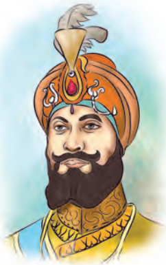
गुरु गोविंद सिंह

सिखों के साथ संघर्ष : सिखों के नौवें धर्मगुरु गुरु तेगबहादुर थे। उन्होंने औरंगजेब की धार्मिक कट्टरता की नीति के विरुद्ध अपना विरोध जताया। औरंगजेब ने उन्हें बंदी बनाया और १६७५ ई.स. में उनका सिर कटवा दिया। उनके पश्चात गुरु गोविंद सिंह सिखों के गुरु बने।