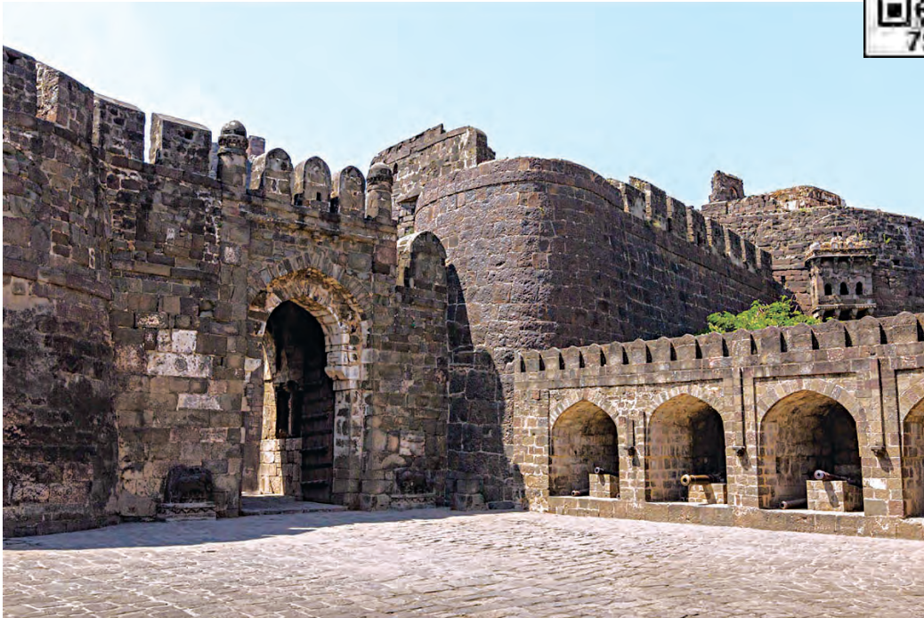
देवगिरी का किला