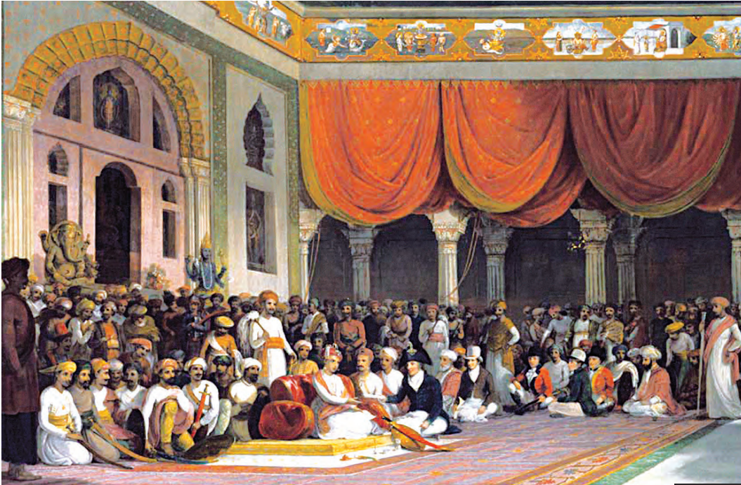
सवाई माधवराव पेशव्यांचा दरबार