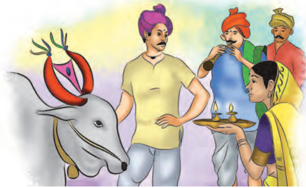
बैलपोळा (बैलों की पूजा का त्योहार)

शुभकार्य प्रारंभ करते हैं। इस दिन शस्त्रों और औजारों की पूजा की जाती। सीमोल्लंघन करते। एक-दूसरे को शमी के पत्ते देते। दशहरे के बाद मराठे युद्ध अभियान पर निकलते। दीवाली में बलि प्रतिपदा (दीपावली पाडवा) और भाई दूज विशेष रूप से मनाए जाते। गाँव-देहात में मेले लगते। मेलों में दंगल (कुश्ती) के अखाड़े लगते। गुढ़ी पाडवा के दिन गुढ़ी (धार्मिक ध्वजा) खड़ी कर यह त्योहार मनाया जाता। उत्सव-पर्वों में नृत्य-गान, डफ (चंग) के गीत, तमाशा (नौटंकी) आदि मनोरंजन के कार्यक्रम होते। तमाशा (नौटंकी, लोकनाट्य) मनोरंजन का लोकप्रिय प्रकार था।