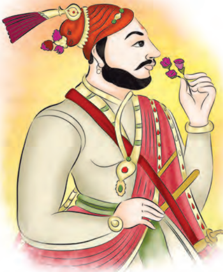
छत्रपती संभाजी महाराज

छत्रपती संभाजी महाराज: संभाजी महाराज हे छत्रपती शिवाजी महाराजांचे ज्येष्ठ पुत्र होत. त्यांचा