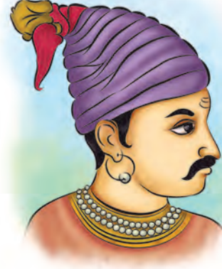
छत्रपती राजाराम महाराज

महाराज : राजाराम महाराज हे छत्रपती शिवाजी महाराजांचे द्वितीय पुत्र होत. त्यांचा जन्म २४ फेब्रुवारी १६७० रोजी रायगडावर झाला.