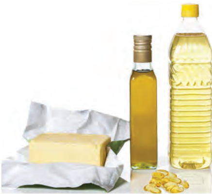
७.३ : स्निग्ध पदार्थ

वाढत्या वयातील मुला-मुलींना रोज साधारणपणे २०००-२५०० किलोकॅलरी ऊर्जा अन्नातून मिळण्याची गरज असते.