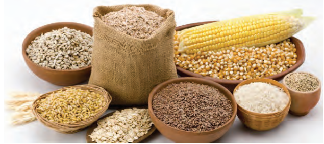
७.२ : तृणधान्ये

आपली मुख्य गरज ऊर्जेची असते. ती कबोदकांमुळे भागते. त्यामुळे आपल्या आहारात भात, पोळ्या, भाकरी अशा पदार्थांचा प्रामुख्याने समावेश असतो, म्हणून जास्त प्रमाणात कबोदके देणारी तृणधान्ये आपल्या अन्नातील प्रमुख घटक आहेत.