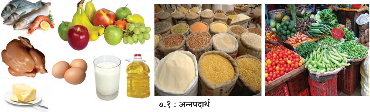
७.१ : अन्नपदार्थ

अन्नपदार्थांचे गट कोणते? चित्रांतील अन्नपदार्थांची नावे सांगा. त्यांच्यापासून कोणते मुख्य अन्नघटक मिळतात?