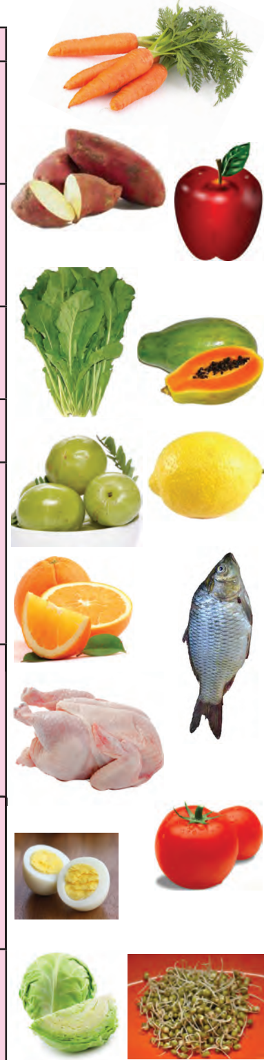
७.५ : जीवनसत्त्वे

गटकार्य : नाट्यीकरणाच्या आधारे वरील तक्त्याचे वर्गात सादरीकरण करावे.