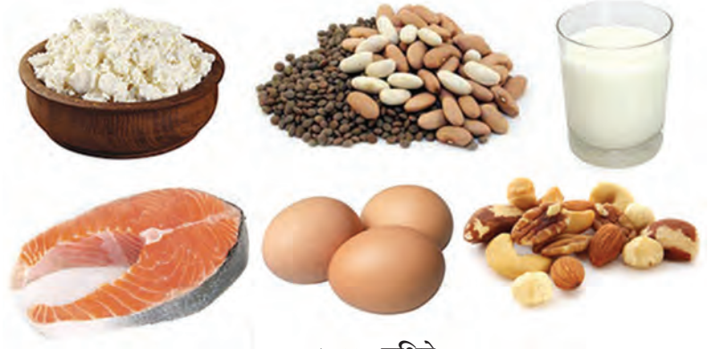
७.४ : प्रथिने

वाढीसाठी, शरीराची होणारी झीज भरून काढण्यासाठी व इतर जीवनक्रियांसाठी आवश्यक असलेली प्रथिने, कडधान्ये, दूध व दुग्धजन्य पदार्थ तसेच मांस, अंडी अशा अन्नपदार्थांपासून मिळतात.