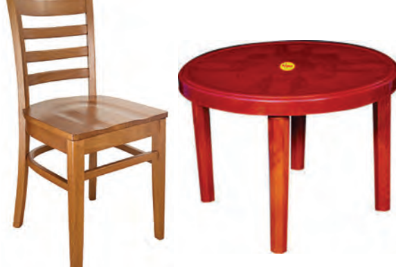
६.१ : विविध वस्तू