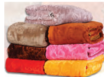
६.४ : कृत्रिम धाग्यांचे उपयोग