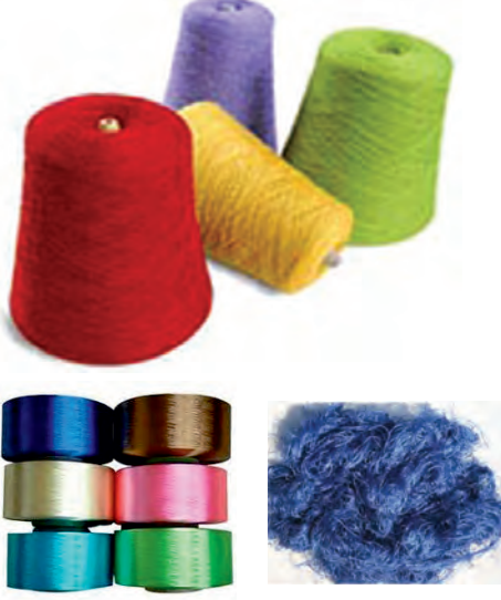
६.३ : कृत्रिम धागे