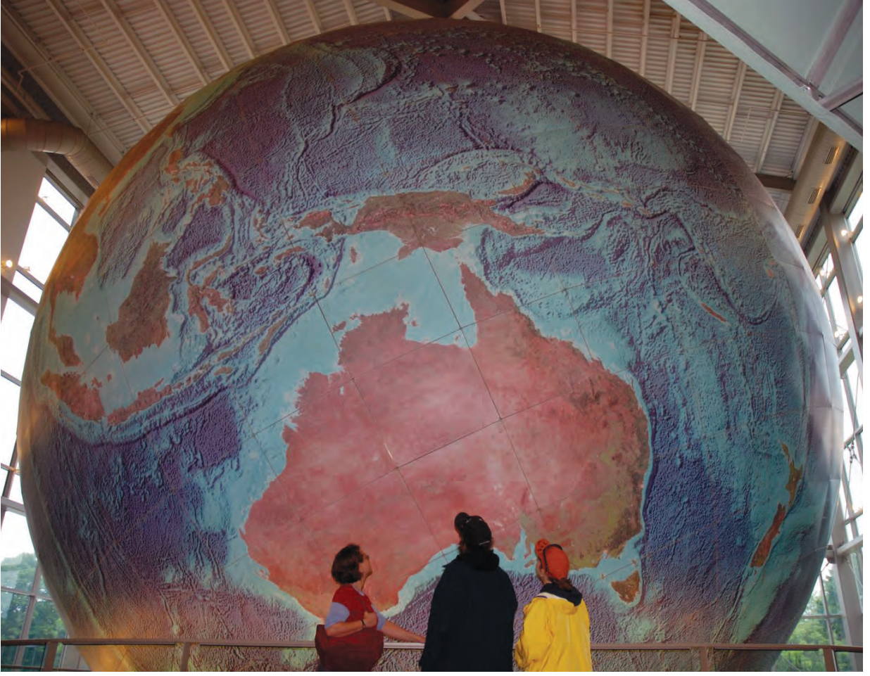
आकृती ३.२ : अर्था

राज्यात ‘यारमथ्’ (Yarmouth) येथे ही पृथ्वीची महाकाय प्रतिकृती आहे. या पृथ्वीगोलाच्या परिभ्रमणाचा व परिवलनाचा वेग पृथ्वीच्या वेगानुसार राखलेला आहे.