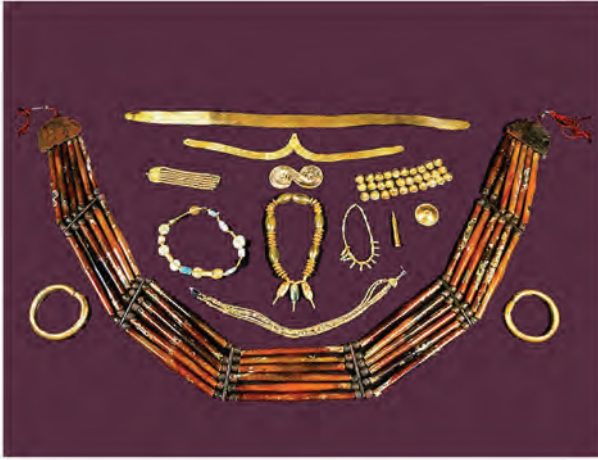
हड़प्पा संस्कृति के आभूषण

उत्खनन में विभिन्न प्रकार के गहने/आभूषण पाए गए हैं। वे गहने/आभूषण स्वर्ण, तांबा, रत्न तथा सीपियाँ, कौड़ियाँ, बीज आदि से बने हुए थे। बहुपरतोंवाली मालाएँ, अँगूठियाँ, बाजूबंद, और कमरबंद (करधनी) जैसे आभूषणों का स्त्री-पुरुष उपयोग करते थे। स्त्रियाँ भुजा तक चूड़ियाँ पहनती थीं।