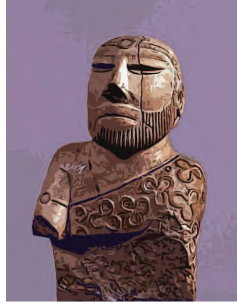
हड़प्पाकालीन कला का नमूना

यहाँ पाया गया वैशिष्ट्यपूर्ण एक पुतला हड़प्पाकालीन कला का उत्कृष्ट नमूना है। उसके चेहरे का प्रत्येक भाव बहुत स्पष्ट है। यही नहीं बल्कि उसके द्वारा कंधे पर ओढ़ी हुई शाल तथा उस शाल पर अंकित त्रिदल की नक्काशी बहुत ही कलात्मक ढंग से दर्शाई गई है।