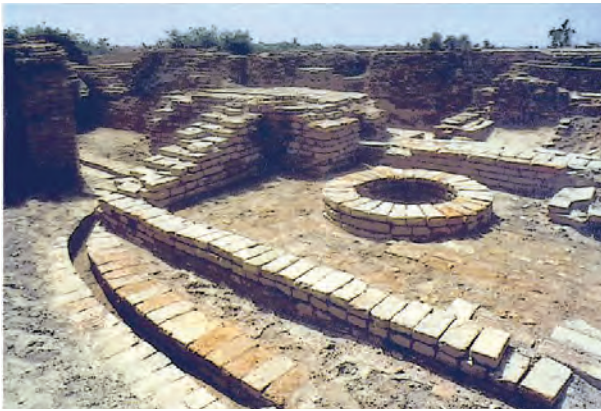
हड़प्पा संस्कृति का कुआँ

हड़प्पा संस्कृति के लोगों के मकान और अन्य निर्माण कार्य मुख्य रूप से पक्की ईंटों से बने हुए थे। कुछ स्थानों पर निर्माण कार्य के लिए कच्ची ईंटों और पत्थरों का भी उपयोग किया जाता था। मकान के बीचोंबीच चौक और उसके चारों ओर कमरे बनाए जाते थे। इस प्रकार की संरचना मकानों की होती थी। मकानों के अहाते में कुएँ, स्नानगृह, शौचालय होते थे। गंदे जल का निपटारा कराने के लिए समुचित प्रबंधन किया जाता था। इसके लिए मिट्टी के पक्के परनारों का उपयोग किया जाता था। सड़कों की नालियाँ ईंटों से बनाई जाती थीं। ये नालियाँ ढँकी होती थीं। इससे यह स्पष्ट होता है कि हड़प्पाकालीन लोग स्वास्थ्य के प्रति कितने अधिक जागरूक थे।