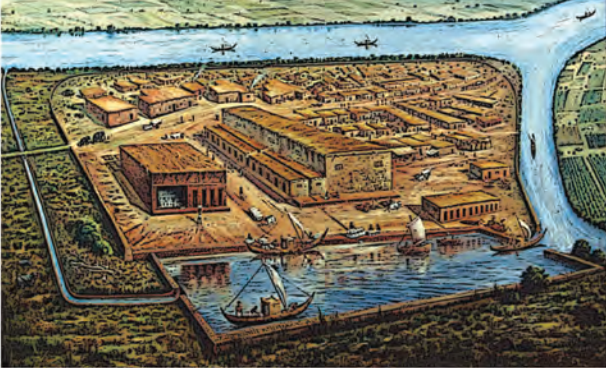
लोथल का बंदरगाह (अवशेषों के आधार पर पुनर्चना)