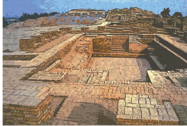
मोहनजोदड़ो का महास्नानागार

मोहनजोदड़ो में एक विशाल स्नानगृह पाया गया है। महास्नानागार का स्नानकुंड लगभग २.५ मीटर गहरा था । उसकी लंबाई लगभग १२ मीटर और चौड़ाई लगभग ७ मीटर थी । कुंड का पानी रिस न जाए; इसके लिए उसे भीतर से पक्की ईंटों से बाँधा गया था । उसमें उतरने की व्यवस्था थी तथा समय-समय पर कुंड का पानी बदलने की सुविधा भी थी ।