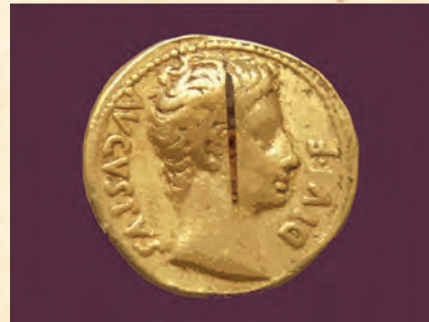
रोमन सम्राट ऑगस्टस याचे अरिकामेडू येथे मिळालेले सोन्याचे नाणे

तमिळनाडूमधील अरिकामेडू येथील उत्खननातही रोमन बनावटीच्या अनेक वस्तू सापडल्या आहेत. दोन्ही