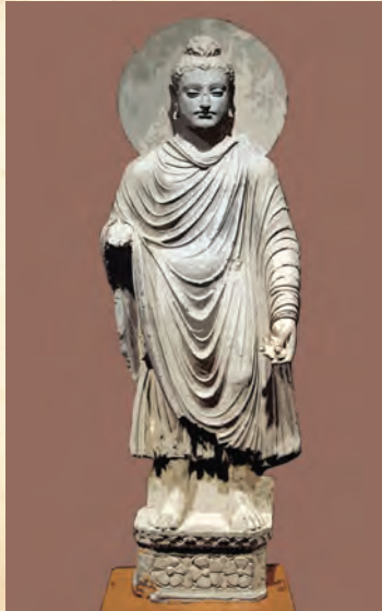
पॅरिस येथील संग्रहालयातील गौतम बुद्धांची मूर्ती-गांधार शैली

इसवी सनाच्या पहिल्या-दुसऱ्या शतकाच्या काळात भारत आणि रोम यांच्यामधील व्यापार भरभराटीस आला होता. या व्यापारात दक्षिण भारतातील बंदरांचाही मोठा वाटा होता. महाराष्ट्रातील कोल्हापूर येथील उत्खननात कासे या धातूच्या काही वस्तू सापडल्या. त्या रोमन बनावटीच्या आहेत.