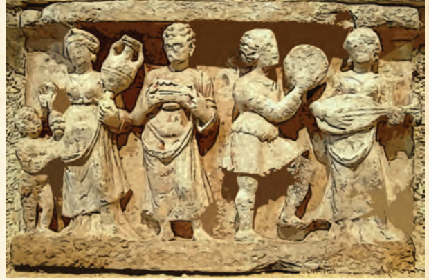
अफगाणिस्तानमधील हड्डा येथील स्तूपावरचे गांधार शैलीचे शिल्प. ग्रीक लोकांचा पोशाख, अँफोरा (एकप्रकारचा कुंभ) आणि वाद्ये

सापडल्या, म्हणून त्या शैलीस 'गांधार शैली' असे म्हटले जाते. या शैलीतील मूर्तींची चेहरेपट्टी ग्रीक चेहरेपट्टीशी मिळतीजुळती आहे. भारतातील सुरुवातीची नाणीही ग्रीक नाण्यांच्या धर्तीवर घडवलेली होती.