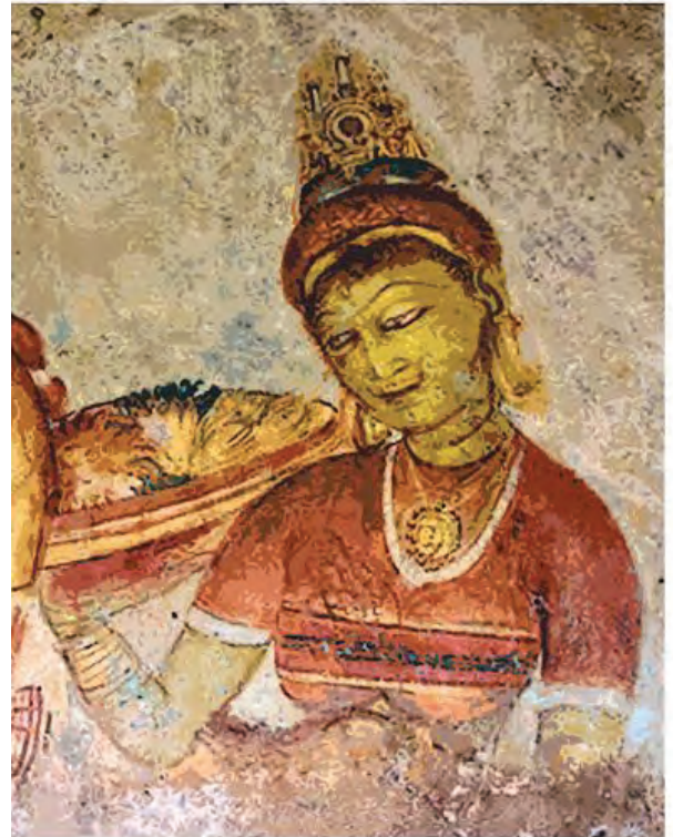
सिगिरिया लेण्यांतील भित्तिचित्र

श्रीलंका : बौद्ध धर्माचा प्रसार करण्यासाठी सम्राट