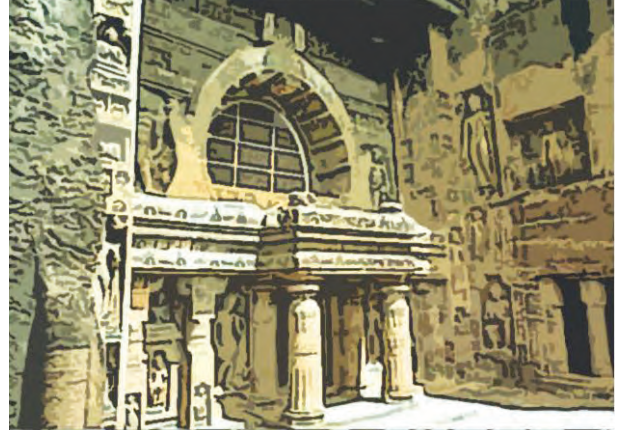
अजिंठा येथील एक लेणे

साम्राज्य उत्तरेस माळवा आणि गुजरात या प्रदेशांपासून दक्षिणेस कोल्हापूरपर्यंत पसरले होते. कोल्हापूरचे त्या काळातील नाव 'कुंतल' असे होते. गुप्त सम्राट दुसरा चंद्रगुप्त याची मुलगी प्रभावती हिचा विवाह दुसरा रुद्रसेन या वाकाटक राजाशी झाला होता, याची माहिती आपण यापूर्वी घेतली आहे. हरिषेण या वाकाटक राजाचा वराहदेव नावाचा मंत्री होता. तो बौद्ध धर्माचा अनुयायी होता. अजिंठा येथील १६ क्रमांकाचे लेणे