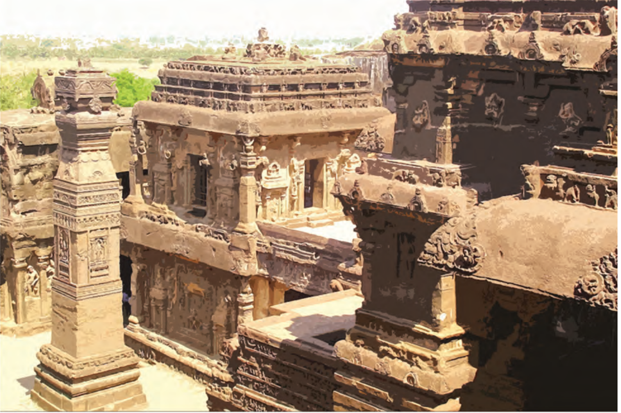
वेरूळ येथील कैलास लेणे

आतापर्यंत आपण प्रामुख्याने प्राचीन भारतातील विविध राजकीय सत्तांची माहिती घेतली. पुढील पाठात प्राचीन भारतातील सामाजिक आणि सांस्कृतिक जीवनाचा आढावा घेऊ.