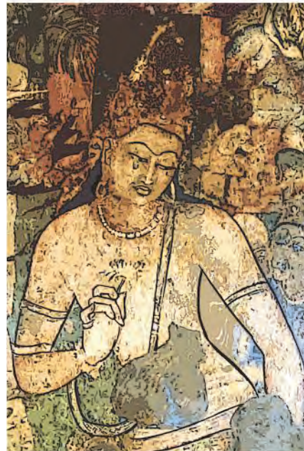
अजिंठा येथील बोधिसत्त्व पद्मपाणि

त्याने खोदवून घेतले होते. अजिंठ्याच्या इतरही काही लेण्यांमधील खोदाईचे, तसेच ती लेणी चित्रांनी सुशोभित करण्याचे काम हरिषेणाच्या कारकिर्दीत झाले. वाकाटक राजा दुसरा प्रवरसेन याने 'महाराष्ट्री' या प्राकृत भाषेतील