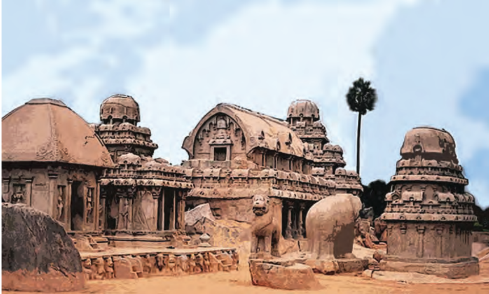
महाबलिपुरम येथील रथमंदिरे

पल्लव राजसत्ता दक्षिण भारतातील एक प्रबळ राजसत्ता होती. तमिळनाडूतील कांचीपुरम ही त्यांची