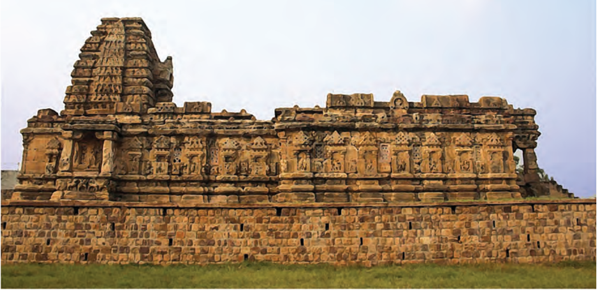
पट्टदकल येथील मंदिर

केले. पहिला पुलकेशी याने इसवी सनाच्या सहाव्या शतकात चालुक्य घराण्याची स्थापना केली. कर्नाटकातील बदामी येथे त्याची राजधानी होती. बदामीचे प्राचीन नाव ‘वातापि’ असे होते. चालुक्य राजा दुसरा पुलकेशी याने सम्राट हर्षवर्धनाचे आक्रमण परतवून लावले होते. बदामी, ऐहोळे, पट्टदकल येथील प्रसिद्ध मंदिरे चालुक्य राजांच्या कारकिर्दीत बांधली गेली.