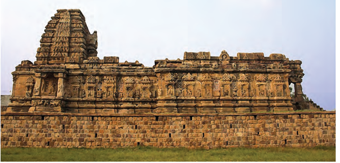
पट्टदकल का मंदिर

की छठी शताब्दी में पुलकेशिन (पुलकेशी) प्रथम ने चालुक्य राजवंश की स्थापना की। कर्नाटक में बदामी उसकी राजधानी थी। बदामी का प्राचीन नाम 'वातापि' था। चालुक्य राजा पुलकेशिन (पुलकेशी) द्वितीय ने सम्राट हर्षवर्धन के आक्रमण को विफल बनाया था। बदामी, ऐहोले, पट्टदकल में प्रसिद्ध मंदिरों का निर्माण चालुक्य राजाओं के कार्यकाल में किया गया।