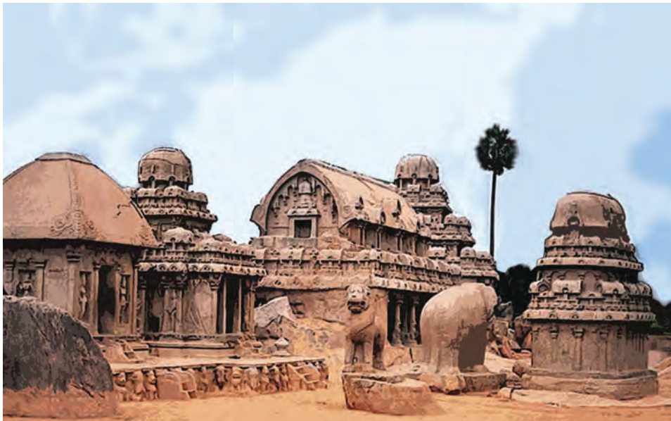
महाबलिपुरम का रथ मंदिर

पल्लव राजसत्ता दक्षिण भारत की एक सशक्त राजसत्ता थी। तमिलनाडु की कांचीपुरम नगरी उनकी राजधानी