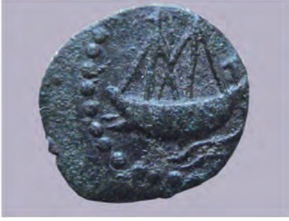
जहाज की प्रतिमा अंकित सातवाहन का सिक्का

प्रतिमाएँ अंकित हैं। महाराष्ट्र के अजिंठा (अजंता), नाशिक, कार्ले, भाजे, कान्हेरी, जुन्नर की गुफाओं में से कुछ गुफाओं का खनन सातवाहन के समय में किया गया है।