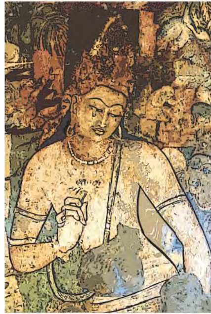
अजिंठा (अजंता) में बोधिसत्त्व पद्मपाणि

गुफा का खनन उसने करवाया था। अजिंठा की अन्य कुछ गुफाओं में खुदाई तथा उन गुफाओं के चित्रों से सुशोभित करने का कार्य हरिषेण के कार्यकाल में हुआ। वाकाटक राजा प्रवरसेन द्वितीय ने प्राकृत