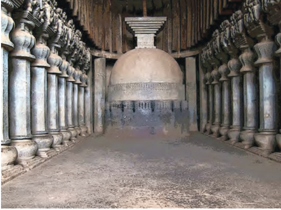
कार्ले का चैत्यगृह