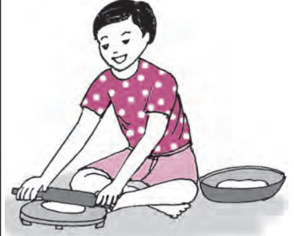
रोटी बेलो ।