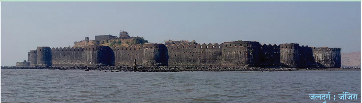
जलदुर्ग : जंजिरा

इन सभी द्वीपों के स्थान देश की सुरक्षा की दृष्टि से अत्यंत महत्त्वपूर्ण हैं। महाराष्ट्र के तटवर्ती क्षेत्र की रक्षा के लिए इनमें से कुछ द्वीपों पर किलों का निर्माण किया गया है। ये ऐतिहासिक किले जलदुर्ग के रूप में जाने जाते हैं। कोंकण के तट पर ऐसे किले कई स्थानों पर दिखाई देते हैं।