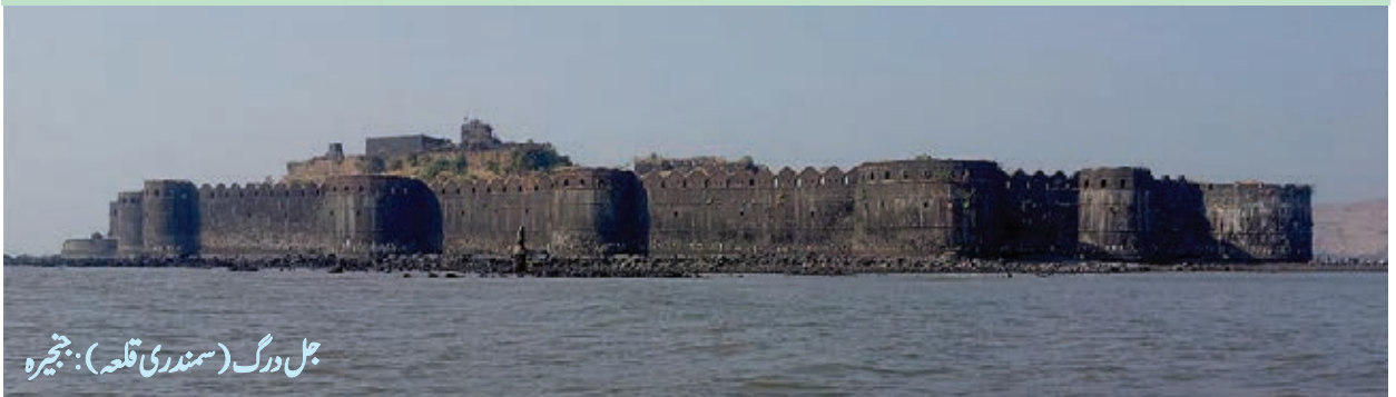
جل درگ (سمندری قلعہ): ججیرہ

بھارت کے علاقے میں اصل بھارتی زمین کے علاوہ بے شمار جزائر بھی شامل ہیں۔ ۱۔ بحر عرب میں لکش دوپ کے جزیرے ہیں۔ ۲۔ بحیرہ بنگال میں اندمان اور نکوبار جزائر ہیں۔ ۳۔ بھارت کی اصل زمین کے قریب سمندر میں جزیرے ہیں۔