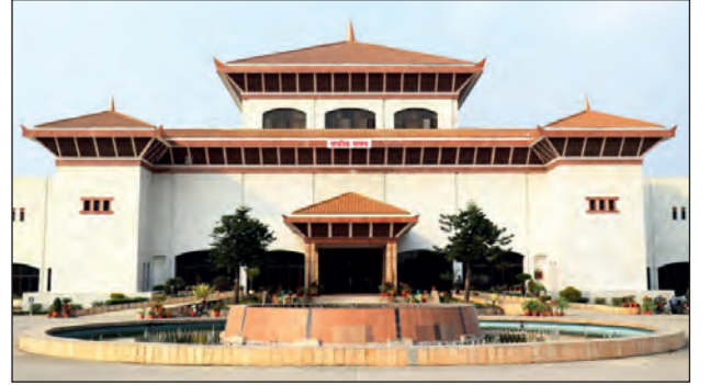
नेपाळचे संसदभवन, काठमांडू