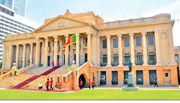
राष्ट्राध्यक्षांचे सचिवालय, कोलंबो