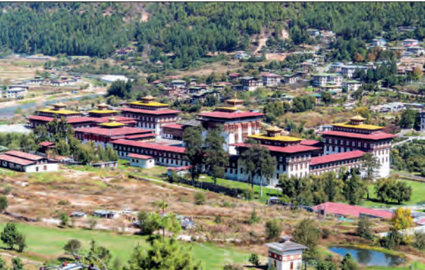
थिंपू येथील राजवाडा