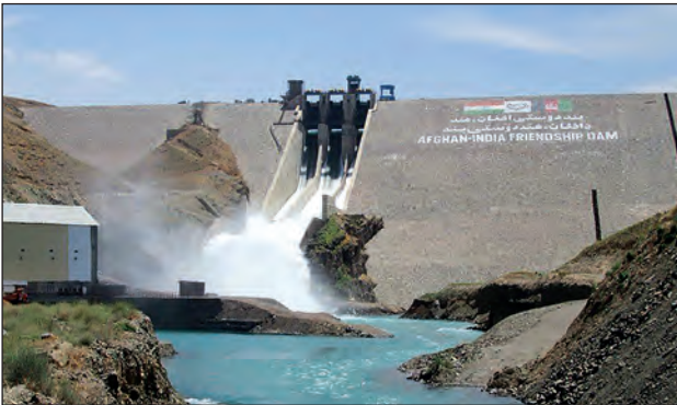
अफगाणिस्तान-भारत मैत्री धरण

धरण बांधण्यासाठी मदत केली. या धरणाला अफगाणिस्तान-भारत मैत्री धरण (पूर्वीचे सलमा धरण) असे म्हणतात.