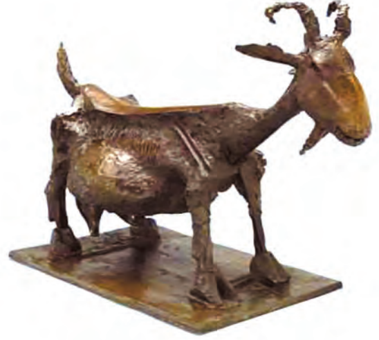
शिल्प : द गोट