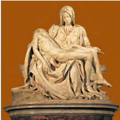
शिल्प : पिएता

वैशिष्ट्ये : येशू ख्रिस्ताला क्रूसावरून खाली उतरवल्यावर मृत येशू ख्रिस्तास मेरीने मांडीवर घेतलेले आहे असे दृश्य या शिल्पात आहे. मेरीच्या मांडीवरील निष्प्राण ख्रिस्ताच्या देहाचे वास्तव शिल्पांकन मायकेल अँजेलोने केले आहे. मेरी ही ख्रिस्तापेक्षा तरुण दाखवली आहे. माता ही अमर असते. ती कधीही वयस्कर होत नाही. मूल कितीही मोठे झाले तरी त्याची काळजी ती घेत असते. आई ही भावना कधीच वयस्कर होऊ शकत नाही. ती शेवटपर्यंत तरुणच राहते, असे मायकेल अँजेलो यांचे मत होते. त्यानुसार त्यांनी या शिल्पात मेरी तरुण दाखवली आहे.