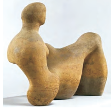
शिल्प : 'द सीटेड वुमन'

त्याला त्याची कलाकृती एकाच वेळी अनेकांना बघता येईल अशा ठिकाणी ठेवायची असे म्हणून त्याची बहुतेक शिल्पे एखाद्या बागेत किंवा डोंगरावर ठेवलेली आढळतात. खुले आभाळ, हिरवळ आणि खडक यांच्या पार्श्वभूमीवरच्या या अजोड कलाकृती निसर्गाचा भाग वाटतात.