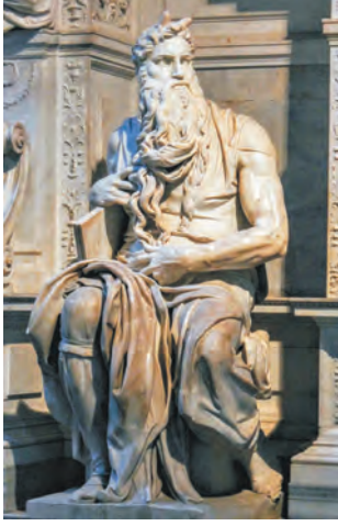
शिल्प : मोझेस