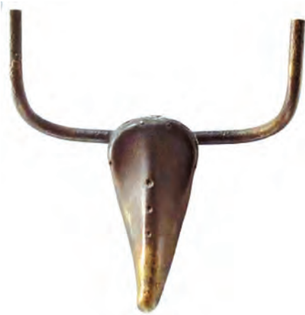
शिल्प : बुल हेड