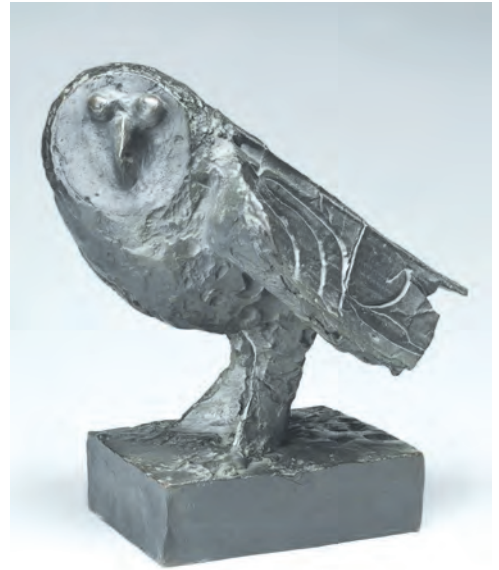
शिल्प : आऊल