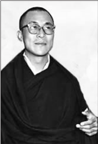
१९५९ मध्ये भारतात प्रवेश केलेले दलाई लामा (१४ वे)

यानंतरच्या काळात तिबेटमध्ये चीनमधील सत्ताधाऱ्यांविरोधात उठाव झाला. तो चीनने बळाने दडपला. याच काळात तिबेटी धर्मगुरू दलाई लामा तेथून निसटून ३१ मार्च १९५९ रोजी भारतात आले. त्यांना राजकीय आश्रय देण्यात आला. मात्र, तसे करताना दलाई लामा भारतात कोणत्याही राजकीय कार्यक्रमांमध्ये सहभागी होणार नाहीत किंवा त्यांचे आयोजन करणार नाहीत, असे आश्वासन घेण्यात आले. यानंतरही तिबेटमध्ये चिनी धोरणांविरोधात असंतोष सुरूच राहिला.