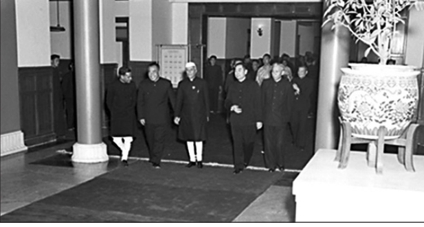
प्रधानमंत्री पंडित जवाहरलाल नेहरू आणि प्रधानमंत्री चौ एनलाय (१९५४)

या पार्श्वभूमीवर भारत आणि चीनने १९५४ मध्ये एक करार केला. त्याचे नाव 'तिबेटी प्रदेशातील व्यापार व इतर संबंधांबाबत भारतीय प्रजासत्ताक आणि चीन (पीपल्स रिपब्लिक ऑफ चायना) यांच्यादरम्यान झालेला करार' असे होते. या कराराची पाच महत्त्वाची तत्त्वे होती. त्यामुळे त्याला 'पंचशील करार' असेही म्हटले जाते. या करारानुसार भारताने तोवर तिबेटवर असलेले सर्व हक्क सोडले आणि तिबेट हा चीनचा एक भाग असल्याचे मान्य केले.