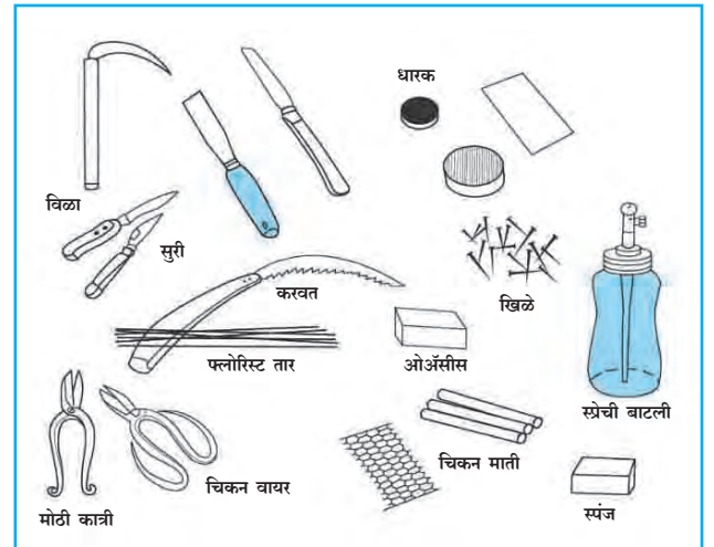
आकृती ८.२ पुष्परचनेसाठी लागणारे साहित्य

७) इतर साहित्य : पाने, फुले कापण्यासाठी धारदार कात्री, चाकू, रबरबॅण्ड, तार, टाचण्या, चिकटपट्टी इत्यादी वापरतात.