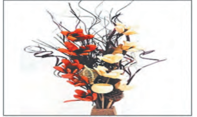
आकृती ८.३ (ई) शुष्क पुष्परचना

४) शुष्क पुष्परचना : भारतामध्ये उन्हाळ्यात तर थंड प्रदेशामध्ये हिवाळ्यात या प्रकारची पुष्परचना केली जाते. जेव्हा निसर्गात ताजी फुले-पाने उपलब्ध नसतात तेव्हा वाळलेली फुले, पाने, तुरे, फांद्या, फळे इत्यादींचा आकर्षकरित्या उपयोग केला जातो. रंगविलेले, वाळविलेले गवत या पुष्परचनेमध्ये प्रभावीपणे वापरले जाते. तसेच वाळलेल्या वनस्पती, गव्हाच्या ओंब्या, ज्वारी-बाजरीची कणसे, कपाशीचे बोंड, वुडरोजची फुले, झाडांची पाने, बुंधे अशा प्रकारचे साहित्य देखील वापरले जाते. बऱ्याचदा उथळ पुष्पपात्र वापरले जाते. सिरॅमिक, लाकडी, पारदर्शक नसलेले काचेचे पुष्पपात्र या प्रकारासाठी योग्य ठरते.