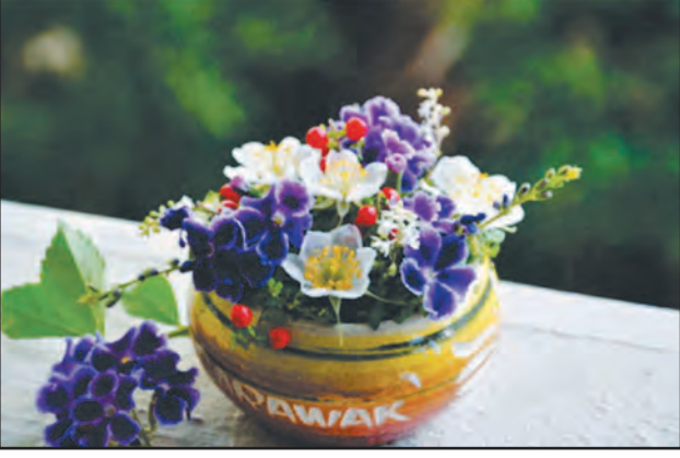
आकृती ८.३ (फ) अल्पाकृती पुष्परचना