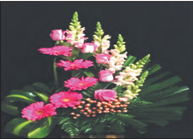
आकृती ८.३ (ड) आधुनिक पुष्परचना

या प्रकारच्या रचनेत पुष्परचनेसाठी कोणते साहित्य वापरले आहे. त्यापेक्षा ते कशाप्रकारे वापरले आहे या गोष्टीला जास्त महत्त्व आहे. मुक्तशैलीमुळे विविध आकारात या पुष्परचना करतात येणे शक्य होते. तसेच कोणत्याही आकारामध्ये रचना करता येते. या रचनांमध्ये लयबद्ध रेषा, प्रभावी रंग, आकार, पोत या गोष्टींना प्राधान्य दिले जाते.