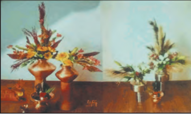
आकृती ८.३ (अ) परंपरागत पुष्परचना

या प्रकारच्या पुष्परचनेमध्ये वेगवेगळ्या प्रकारची पुष्कळ फुले वापरतात. त्यांच्या तुलनेमध्ये पानांची संख्या कमी असते. समान उंचीची फुले समतोल साधला जाईल अशा पद्धतीने रचली जातात. उदाहरणार्थ : गोलाकार पंख्याचा आकार या प्रकारामध्ये उपसाधने म्हणून मेणबत्त्यांचा उपयोग अधिक प्रमाणात केला जातो.