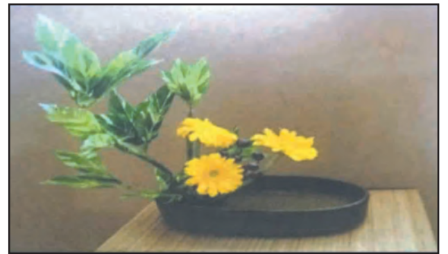
आकृती ८.३ (क) जपानी पुष्परचना