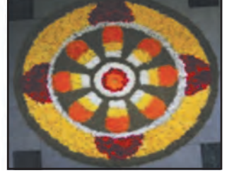
आकृती ८.५ पुष्पसजावटीचे प्रकार