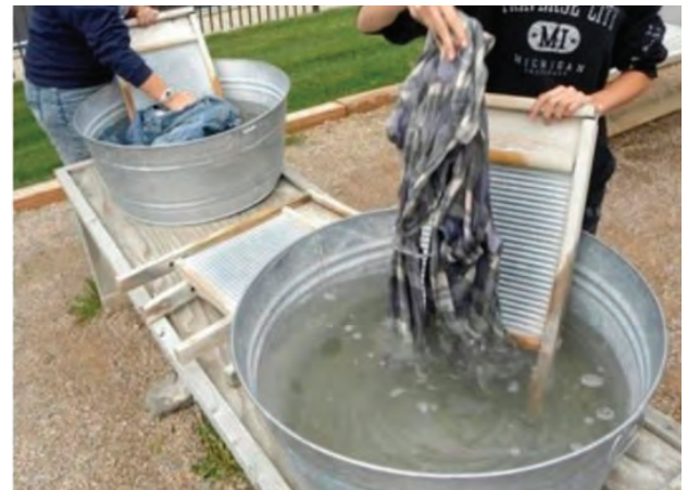
चित्र क्र. ७.३ : घर्षक फळा