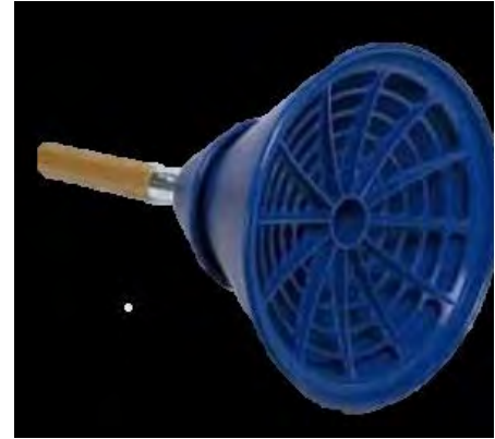
चित्र क्र. ७.५ : चोषण पद्धत

४) यांत्रिक धुलाई : घरगुती धुलाईची ही सर्वात आधुनिक व सोईस्कर पद्धत आहे. यासाठी वीजेवर चालणारे धुलाईयंत्र वापरतात. यामुळे श्रमाची बचत होते. विविध प्रकारचे अनेक कपडे यंत्रात सहजपणे धुता येतात. विविध उत्पादकांची धुलाईयंत्रे बाजारपेठेत उपलब्ध आहेत. धुलाई यंत्रातील धुलाई प्रक्रिया ही पाण्याच्या रेणुंची हालचाल (Pedesis) या सर्वसामान्य तत्त्वावर आधारीत असते.