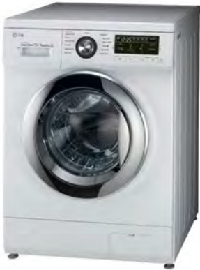
चित्र क्र. ७.७ : पूर्णस्वयंचलित धुलाईयंत्र