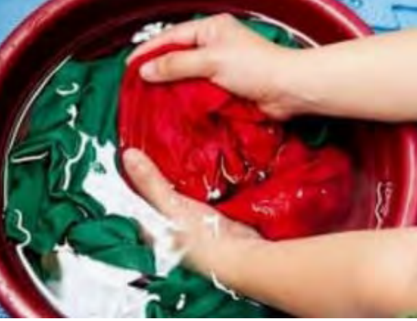
चित्र क्र. ७.४ : खळबळणे व पिळणे पद्धत

या पद्धतीला खळबळणे व पिळणे पद्धत असे म्हणतात. घर्षणामुळे हानी होणाऱ्या नाजूक कपड्यांसाठी ही पद्धत उपयुक्त ठरते. प्रथम साबणाच्या द्रावणात कपडे भिजवतात व नंतर हलकेच खळबळतात. कपड्यांवर जास्त दाब पडणार नाही याची काळजी घेतली जाते. नंतर कपड्यांना हलकेच पिळून साबणाचे पाणी काढून टाकले जाते. म्हणून या पद्धतीला खळबळणे व पिळणे पद्धत म्हणतात. ही पद्धत रेशमी, लोकरी, लेस, नेट यासारख्या नाजूक कपड्यांना वापरतात.