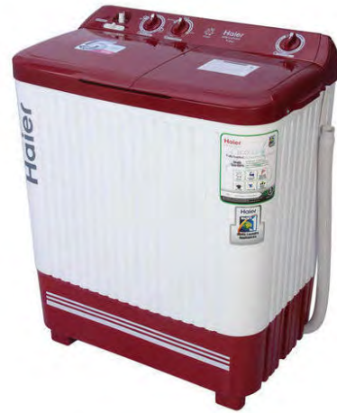
चित्र क्र. ७.६ : अर्धस्वयंचलित