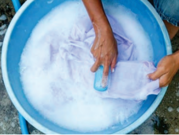
चित्र क्र. ७.२ : ब्रशच्या साहाय्याने घर्षण

ब) ब्रशच्या साहाय्याने घर्षण (Friction With Brush) : कपडे घासण्याचा ब्रश ही एक प्लॅस्टीकची छोटी वस्तू असते जी बाजारात विविध रंगात व आकारात उपलब्ध असते. ब्रशच्या साहाय्याने घर्षण ही घरगुती धुलाईत सर्वात जास्त वापरली जाणारी पद्धत आहे. बहुतांश प्रकारच्या कपड्यांसाठी ही पद्धत उपयुक्त आहे. ब्रशची टोके धाग्यांच्या मध्ये अडकून धागे ओढले जातात. त्यामुळे कापडाला हानी होण्याची शक्यता असते. ही पद्धत टर्कीश टॉवेलसाठी उपयुक्त नाही. कारण ब्रशची टोके कापडाच्या पृष्ठभागावरील फाशामध्ये अडकून धागे तुटतात जर कपडा खूप मोठा असेल तर ब्रशने घासण्यास खूप वेळ व श्रम लागतात.