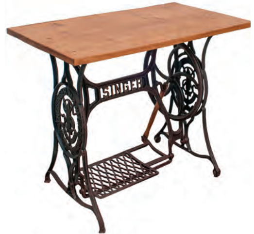
चित्र क्र. २.२ : पाय मशीन

१) ड्राईव्ह व्हील (Drive wheel) : स्टँडच्या उजव्या बाजूला असलेल्या मोठ्या चाकास ड्राईव्ह व्हील म्हणतात. वादीच्या साहाय्याने हे चाक प्लाय व्हीलला जोडलेले असते.