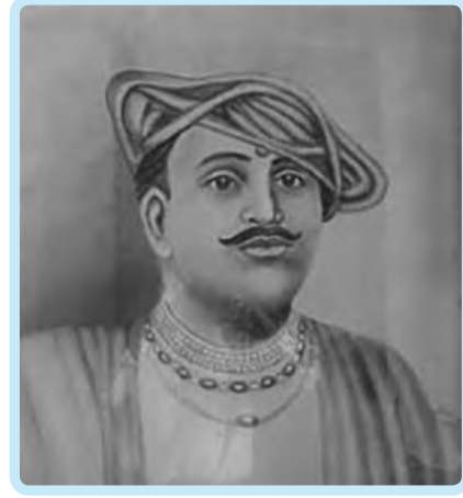
सरखेल कान्होजी आंग्रे

सामर्थ्याचा विकास छत्रपती शिवाजी महाराजांच्या काळात झाला. कोकण किनारपट्टीचे रक्षण करण्यात सरखेल कान्होजी आंग्रे यांची भूमिका महत्त्वाची होती. त्यांनी या प्रदेशात पोर्तुगीज, फ्रेंच आणि ब्रिटीशांना आपल्या सत्ता विस्तारण्यात अडथळा निर्माण केला.