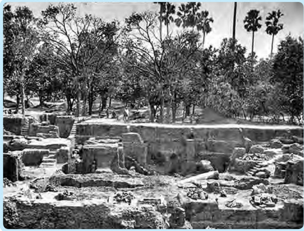
सम्राट अशोकाच्या काळातील संरक्षक भिंती

प्राचीन भारताच्या लष्करी पद्धतीची काही वैशिष्ट्ये पुढीलप्रमाणे सांगता येतील-