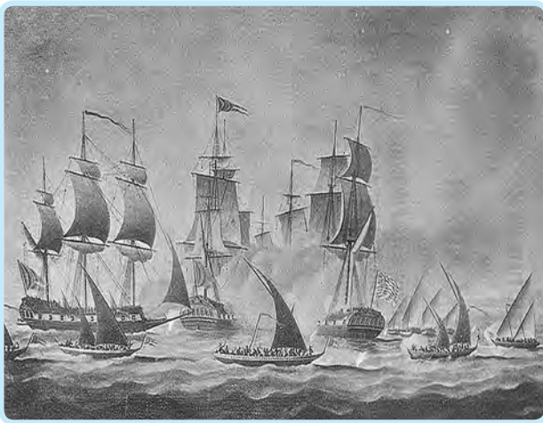
ब्रिटिशांवर आक्रमण करणारे मराठा आरमार

मराठी सत्तेच्या काळात समुद्र किनाऱ्याच्या सुरक्षेबाबत वाढलेली सजगता ही मराठ्यांच्या सामर्थ्य विकासातील महत्त्वाचा भाग होती. मराठ्यांच्या नाविक