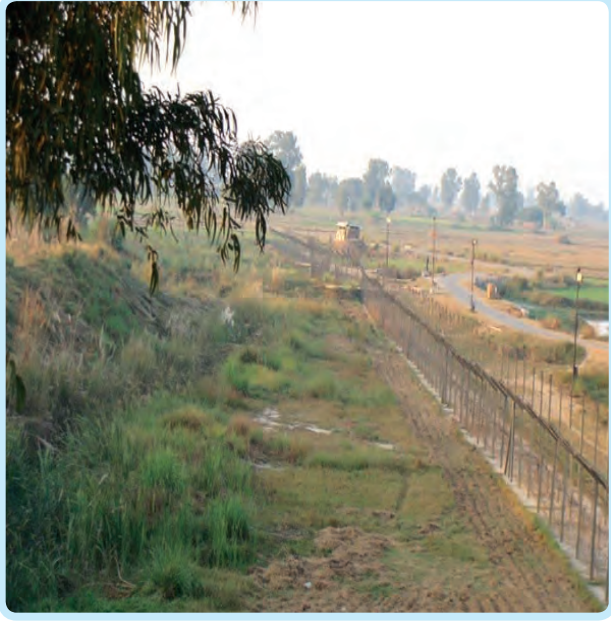
काटेरी तारांचे कुंपण

२) बचावात्मक धोरण : ब्रिटिश काळात वायव्य भारताचा भाग हा संवेदनशील होता. ब्रिटिशांच्या दृष्टीने चीन व पर्यायाने तिबेट हे सुरक्षेच्या दृष्टीने आव्हानात्मक होते. पहिल्या प्रश्नावर ड्यूरंड रेषेच्या मार्गाने उत्तर शोधण्याचा प्रयत्न झाला. तिबेटवर चीनला आधिपत्य करण्याची सुप्त इच्छा होती. परंतु त्याकाळात या रेषेमुळे चीनला तिबेट अधिपत्याखाली आणता आला नाही. तिबेटला स्वायत्त राज्याचा दर्जा प्राप्त झाला होता.