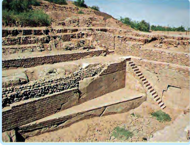
धोलावीरा येथील संरक्षक भिंती

या काळात भारताने परकीय आक्रमणाच्या अनुभवाबरोबरच चोल घराण्याने आपल्या राज्याचा पारंपरिक सीमेपलीकडे केलेला साम्राज्य विस्तारही पाहिला. चोलांनी आपल्या साम्राज्याचा विस्तार बंगालच्या उपसागरातील म्यानमार व आग्नेय आशियापासून सिलोनपर्यंत (श्रीलंका) केला.