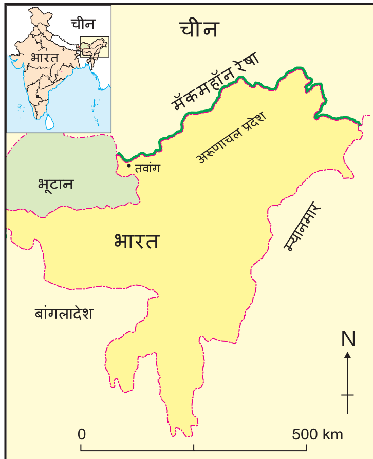
मॅकमहॉन सीमा रेखा