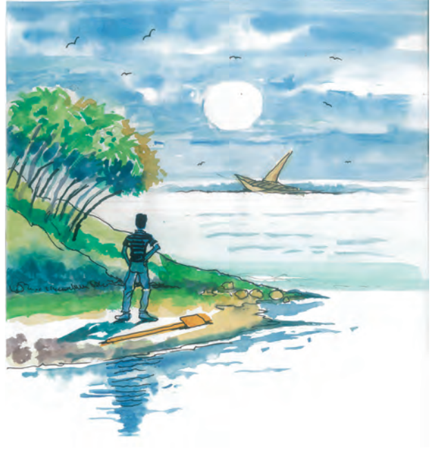
एका एकाकी बेटावर

कल्पना करा. समुद्रात प्रवास करताना वादळात जहाजाची तोडमोड झाल्यावर एक खलाशी जीवरक्षक होडीत बसून आपला जीव वाचवतो.