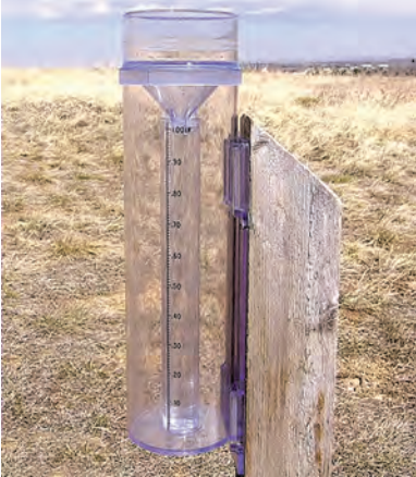
पर्जन्यमापकाची रचना व यंत्र