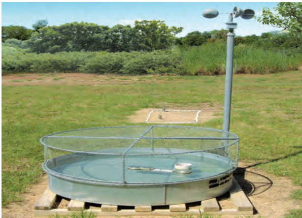
बाष्पीभवन मापक यंत्र

बाष्पीभवन हे इंच किंवा मिलीमीटरमध्ये मोजले जाते. पात्रातील बाष्पीभवन आणि जमिनीवर होणाऱ्या बाष्पीभवनात जो फरक असतो त्यासाठी गुणांक वापरला जातो. तो पश्चिम महाराष्ट्र व कोकणासाठी 0.65 तर मराठवाडा विदर्भात तो 0.8 असा वापरला जातो. प्रत्येक गावात किमान एका ठिकाणी बाष्पीभवन मोजण्याची सोय असणे अतिशय गरजेचे आहे. त्याचा जलआराखड्यासाठी उपयोग होतो.